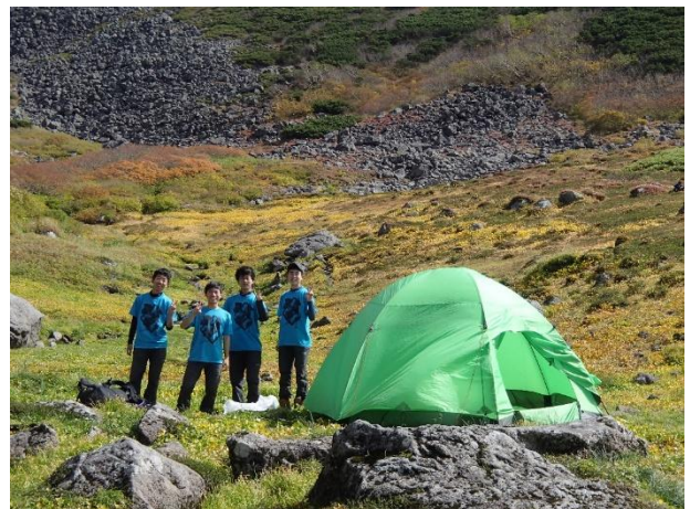
写真5 源頭の幕営地