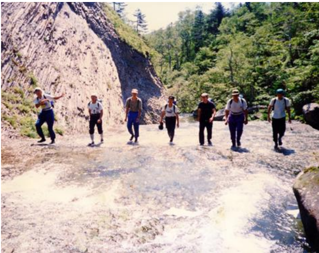
知西別川の滑を行く

装備で知西別川を遡行。源流の羅臼湖へ向かいました。明るく綺麗な沢で、高校生でも行けると聞いていた沢でしたが、なかなか迫力のあるスケールの大きい沢でした。滑床を歩き、大滝を高巻いて羅臼湖に出ました。予想以上に時間がかかり宇登呂側への移動を一日延ばし河口に二泊しましたが生徒一名が高巻きで手を負傷して、引率者三名のうちの一名と別行動で羅臼岳に登ることになりました。長い川では逃げる場所がなく、慎重なる行動が求められます。