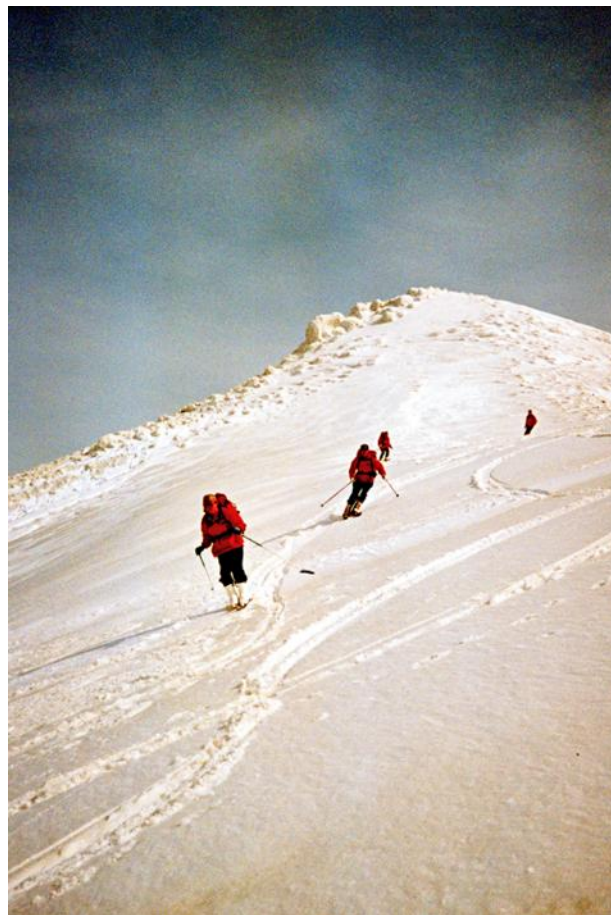
十勝の頂上から（ショートスキーで）

退職した今でもこの時期はショートスキーを背負って十勝岳や旭岳に登ります。富良野岳や、オプタテシケの南側斜面を滑りたいと思いますが、登り返しが大変そうていまだに実行できていませんが。