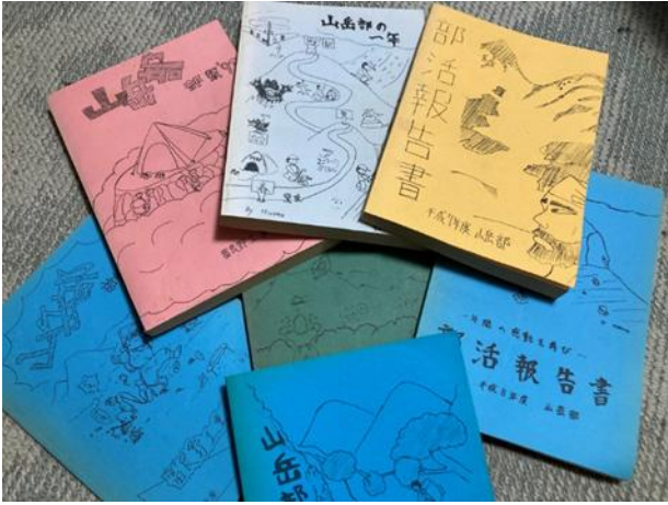
富良野工業高校山岳部報