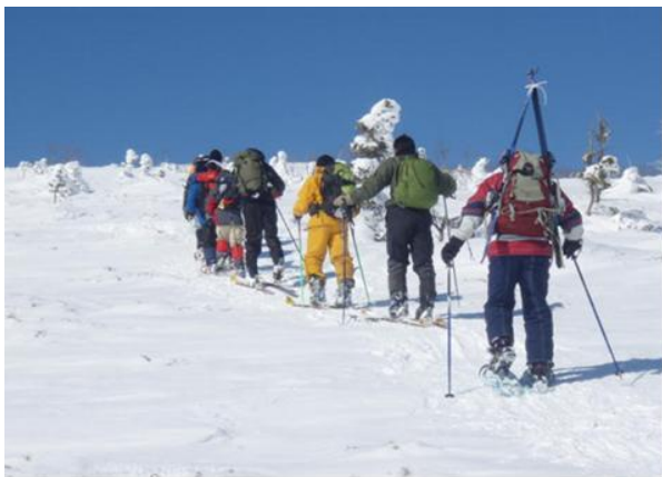
写真2 スキー部隊と樹氷