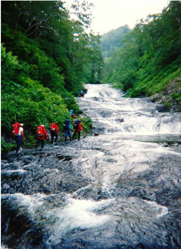
カウナイ沢を行く

に大学山岳部の範疇に足を突っ込むくらいの登山を富良野工業の生徒たちと楽しむことができました。