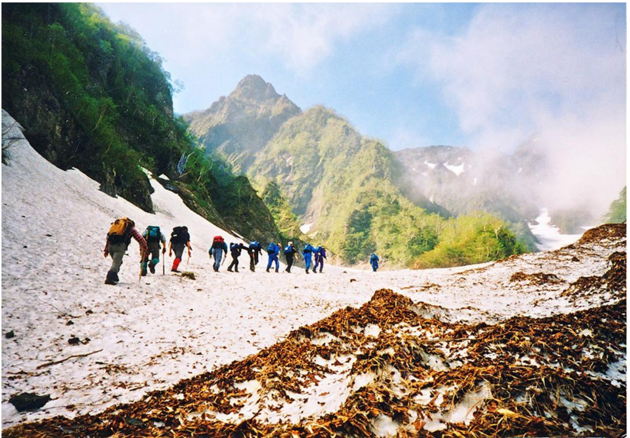
芦別岳ユーフレ沢地獄谷を登る（6月）