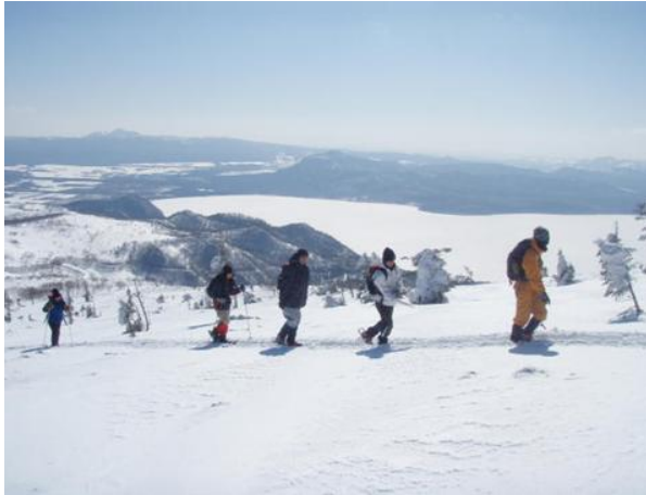
写真1 わかん部隊と凍った屈斜路湖