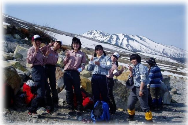
2012年5月 十勝岳避難小屋前

このように、私にとって高校時代の山岳部での経験が人生に与える影響は凄まじく、もしかすると、今、部活に励んでいる皆さんにとっても、人生のターニングポイントの一つとなるかもしれません。登山を通してたくさんのことを感じながら、安全に、そして、存分に山行を楽しんでください。