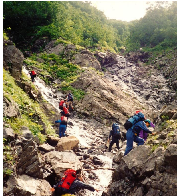
六の沢を登る（別の年次）

ザイル不要と言うことだったので細引きしか持参せず、持たないことを後悔しました。ザイルさえあればあの下れない小滝を難なく吊り降ろせたのにと思いました。ザイル一本は必ず忍ばせておくべきでした。