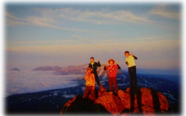
2012年8月 夏合宿トムラウシ山頂にて

最後に、このような記念の誌面に原稿を寄せる機会をいただきましたこと、深く感謝申し上げます。