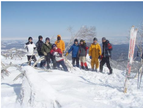
写真3 山頂にて 遠くに流氷が見える