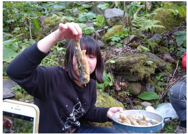
写真3 釣ったオシロコマのムニエル

述の天候状況のため残念ながら見る事が出来なかった。今回のゴール地点である、化雲岳前最後の登りの前で一度小休止をしてから、9時ごろ、山頂に到着した。山頂からの景色は、やはり霧のため、あまりよくはなかった。だが、下山し始めると、段々雲と霧が晴れていき、下山中は絶景を楽しむことができた。僕のまだ短い山行の中で、トップ3に入るくらい下山は大変だったが、下山中に見た滝や紅葉、山々は、どれも秋を感じさせてくれる素晴らしいものだった。僕にとってこの部活での長期合宿&沢登りは最後だったが、とても思い出に残るいい経験になった。