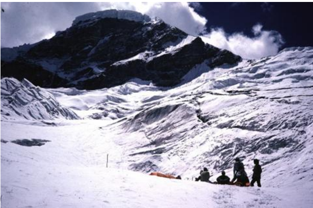
インドヒマラヤZ1峰

横浜市出身の私は北海道の自然に憧れ、北海道の山に登ろうと大学を北海道で過ごし、ワンダーフォーゲル部に所属して北海道の登山を満喫しました。夏は当時まだあった日高山脈の未踏の直登沢をもとめて、冬は日高、大雪、知床の原始性豊かな真っ白い世界で過ごしました。大学卒業後も仲間と一から準備を始め、ヒマラヤの処女峰に遠征をしてさらに登山の楽しさ、奥深さを学びました。