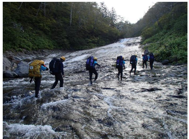
写真4 滑滝（滝ノ瀬十三丁）