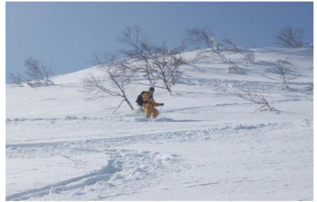
写真4 スキーの真骨頂？