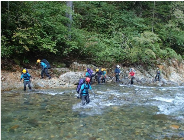
写真1 下流部の徒渉