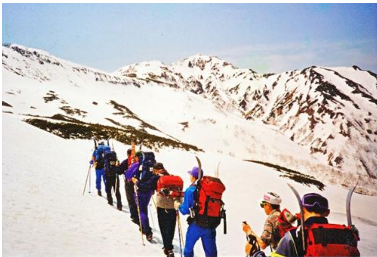
ショートスキーを背負って（五月）