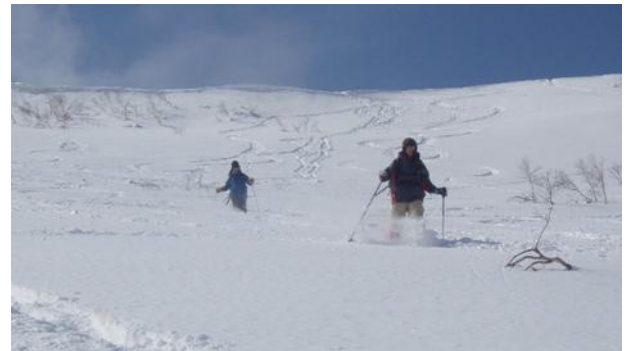
写真5 爆走するわかん部隊